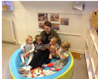
En hyggestund i hulen

På første besøg modtages I af en pædagog fra gruppen, hvor jeres barn har fået plads. I bliver vist rundt, og der er afsat tid til en snak om jeres barn, praktiske informationer om vuggestuen, samt en snak om hvordan starten skal planlægges for jeres barn, sådan at den bliver så god som muligt.